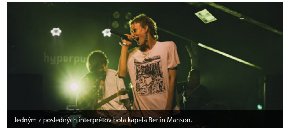
Jedným z posledných interpretov bola kapela Berlin Manson.

Ich koncerty, ako sa dalo čakať, prilákali večer najviac ľudí. Pre dobrú fotku sme spolu s ďalšími fotografmi museli o miesto bojovať. Zvyšok večera vyzeral rovnako. Predrať sa davom ľudí, nafotiť čo sa dá a rýchlo k notebooku editovať. Pri všetkom tom zhone sme nemali čas ani len