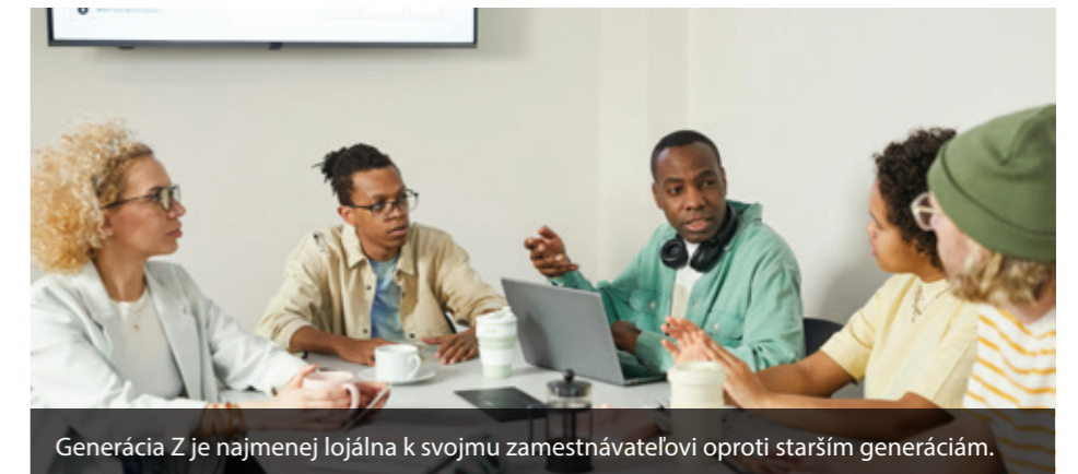
Generácia Z je najmenej lojálna k svojmu zamestnávateľovi oproti starším generáciám.

Pre slovenský magazín Forbes uviedla: „Pôjde o oveľa individuálnejšie dohody medzi zamestnancami a zamestnávateľmi. Nebudú existovať všeobecné pravidlá. Každý bude mať iné potreby a bude sa k nim prístupovať individuálne.“ Dodala, že veľké zmeny môžeme očakávať do piatich rokov. Firmy podľa nej budú ponúkať aj štvordňový pracovný týždeň, ktorý ona sama odporúča.