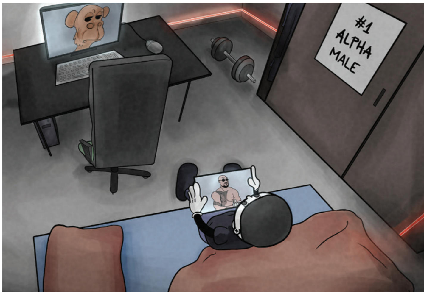
Andrew Tate je môj vzor.