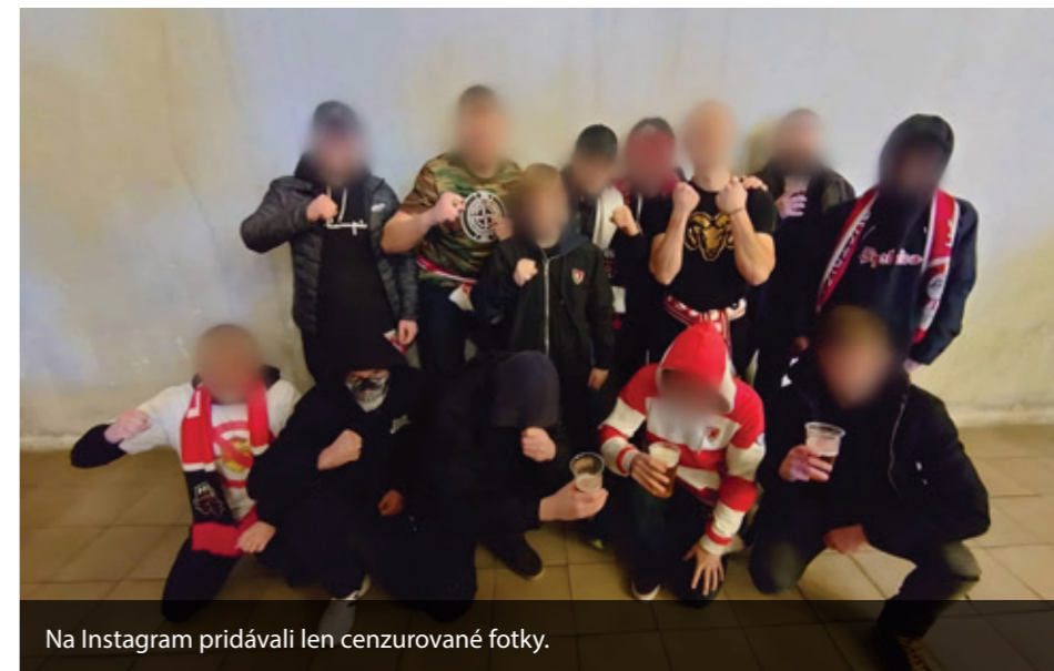
Na Instagram pridávali len cenzurované fotky.

„Kebyže som samotár, určite z tej skupiny neodídem,“ tvrdí s istotou. Mladý osamotený človek v týchto skupinách nájde útočisko. Konečne má svoju partiu, v ktorej majú spoločné témy a záujmy, ako napríklad šport.