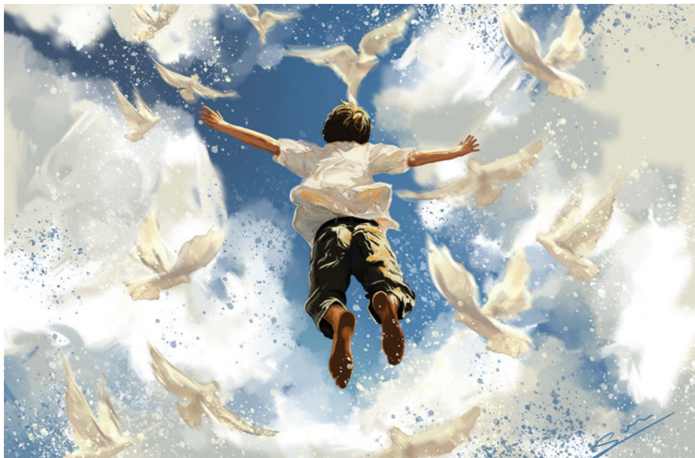
Dotyk neba. (autorka: Soňa Cibuľová)