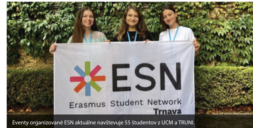
Eventy organizované ESN aktuálne navštevuje 55 študentov z UCM a TRUNI.

Ako v každom tíme, aj ESN má svoje problémy. Pri plánovaní niekedy dochádza ku komunikačnému šumu. Stane sa, že účasť je slabá, ak event nedostatočne spropagujú.