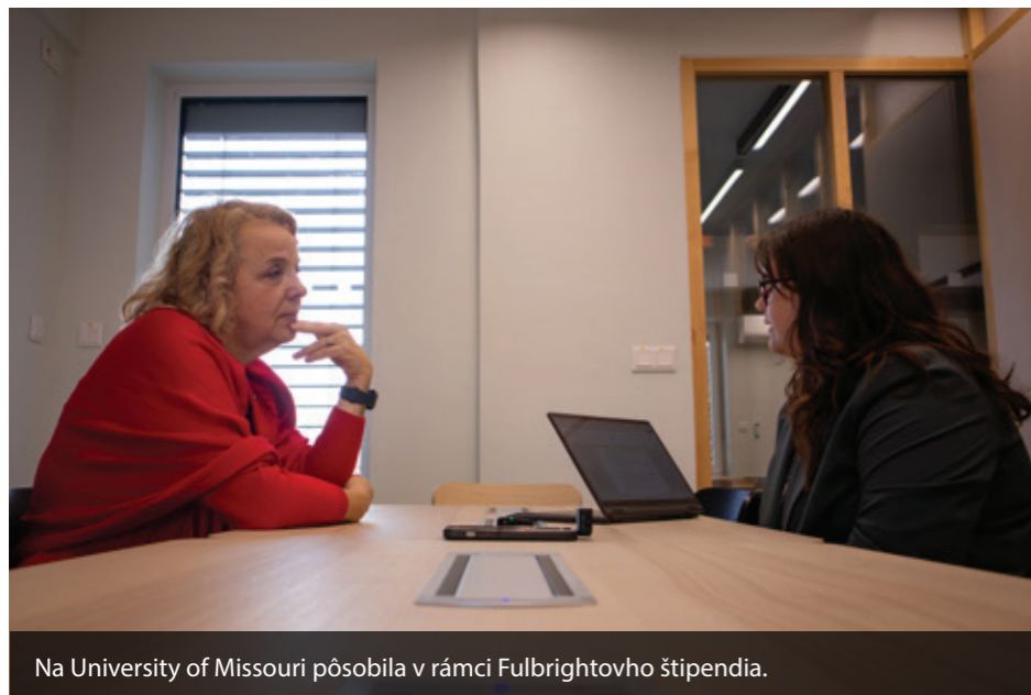
Na University of Missouri pôsobila v rámci Fulbrightovho štipendia.

Určite sa majú a robia to dlhodobo. Robíme vlastné výskumy a prieskumy, v ktorých zisťujeme, čo na našej práci čitatelia oceňujú, čo im chýba a aké majú