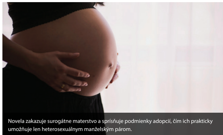
Novela zakazuje surrogátne materstvo a sprísňuje podmienky adopcií, čím ich prakticky umožňuje len heterosexuálnym manželským párom.

Jozefík zdôrazňuje, že realita je však iná: „Rodina je základný pilier spoločnosti, je to faktický stav, nie právny. V roku 2025 to neznamená len otec, mama, deti. Rodinou môže byť