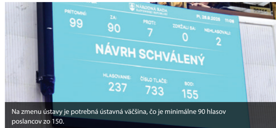
Na zmenu ústavy je potrebná ústavná väčšina, čo je minimálne 90 hlasov poslancov zo 150.